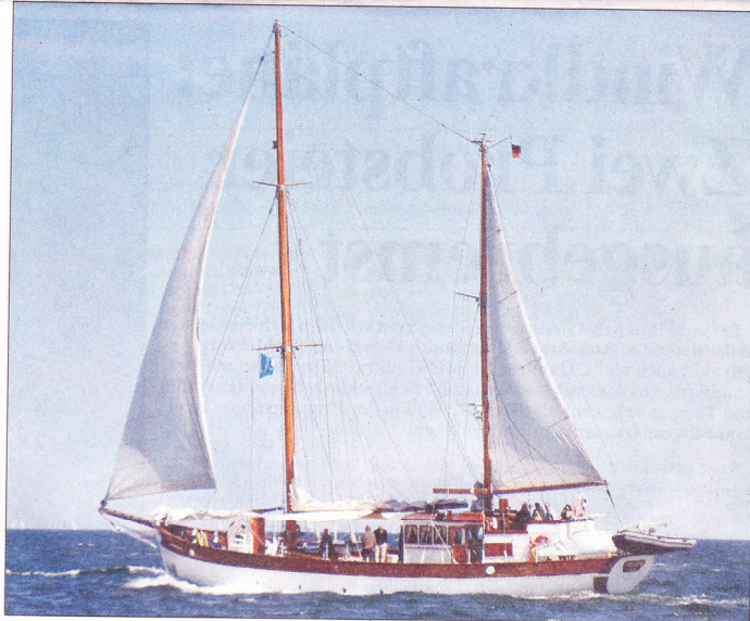
Genießen Sie einen Tag mit der SSB Nordwind auf der Kieler Förde.